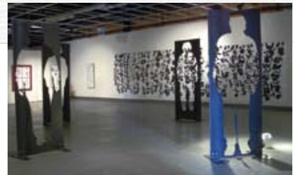
内山玉延・霜鳥健二展/2006年 今井美術館、ファクトリー